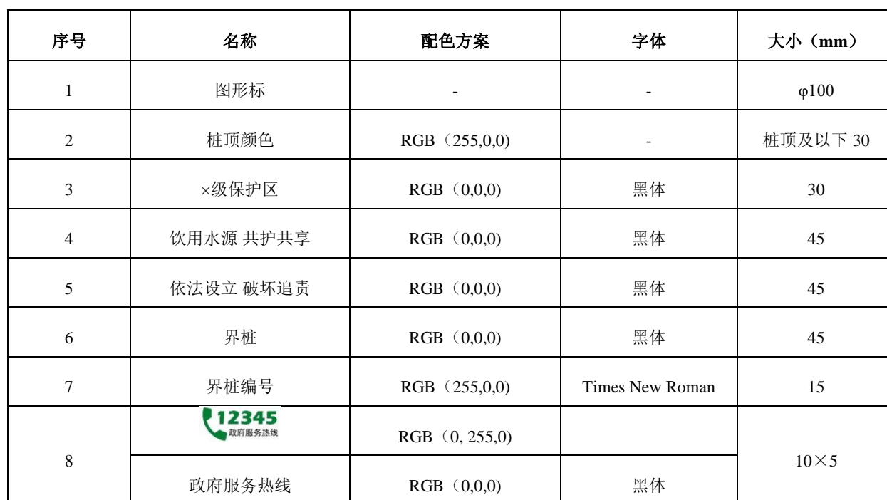
表B.1 饮用水水源保护区界桩版面要素规格